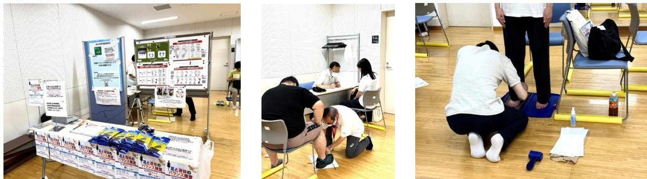
前回「なかはらっぱ祭り」当会出展（2階体育室）の様子